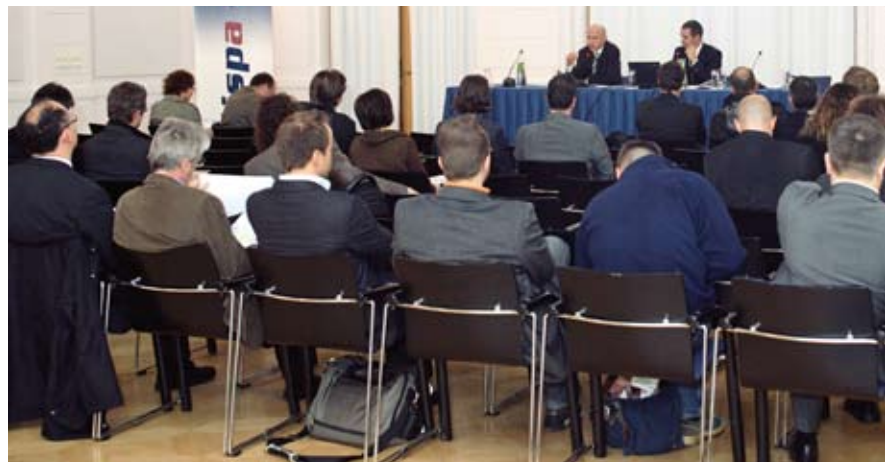
Im Reitersaal der Oesterreichischen Kontrollbank fanden sich die ISPA Mitglieder ein, um ihre Vorstandsvertretung zu wählen.